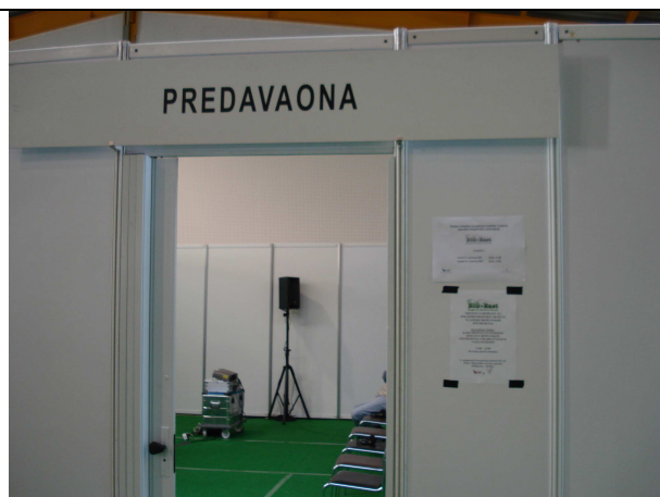
Figure 17 Prostorija za obuku koju je omogućio organizator MESAP-a