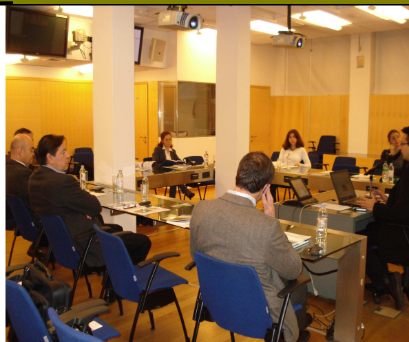
Figure Sudionici na 2.obuci-2.dan