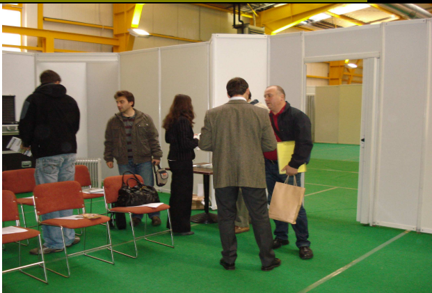
Figure 15 Sudionici stižu na obuku