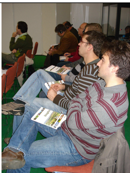
Figure 19 Budući operateri bioplinskih postrojenja