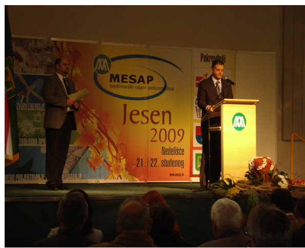
Figure 4 Branimir Horaček, head of energy sector, Ministry of Economy, Labour and Entrepreneurship, Croatia