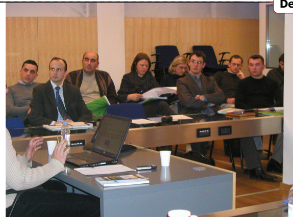
Figure 25, Sudionici na 3.obuci-2.dan