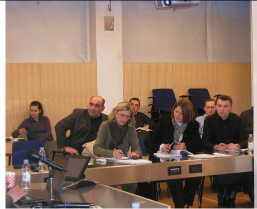
Figure 23, Sudionici na 3.obuci-1.dan