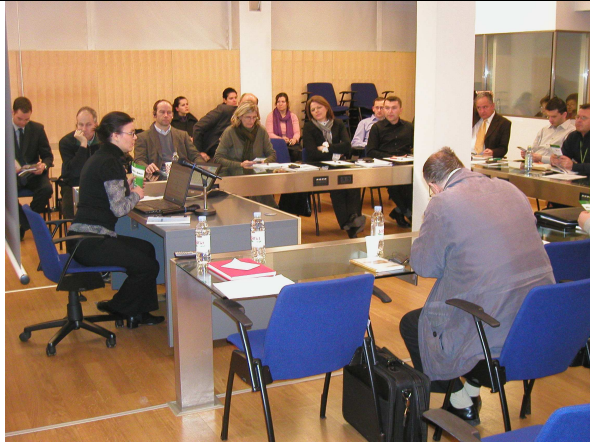
Figure 22, Sudionici na 3.obuci-1.dan