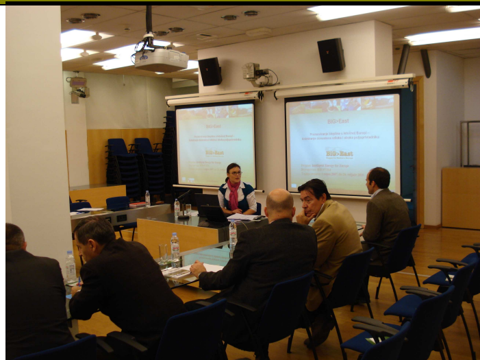
Figure 21 Sudionici na 2.obuci-1.dan