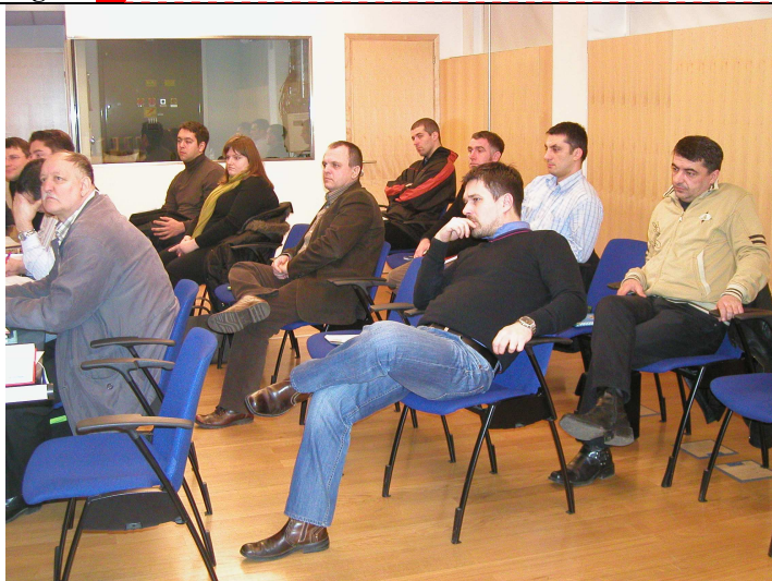
Figure 26, Sudionici na 3.obuci-2.dan