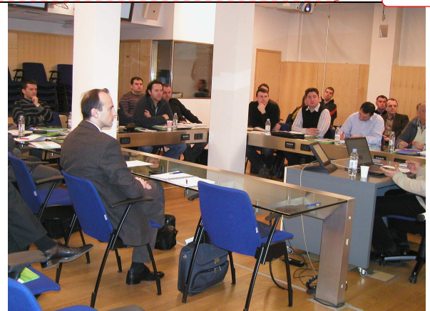
Figure 27, Sudionici na 3.obuci-2.dan