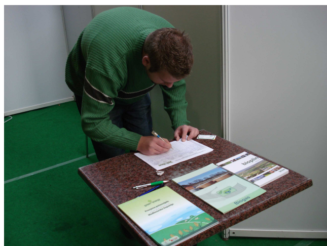
Figure 20 Upisivanje sudionika