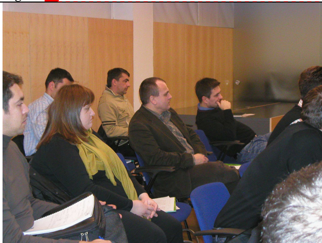
Figure 24, Sudionici na 3.obuci-1.dan