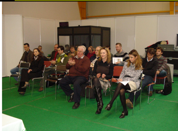
Figure 16 Sudionici na 1.obuci – 1.dan